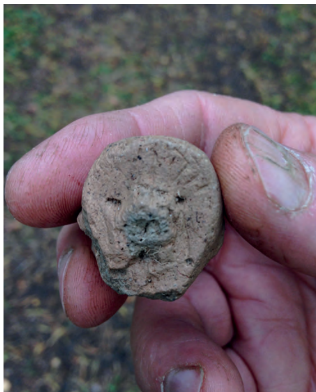
Vad kan det här vara för djur?

Flera av lerfigurerna föreställer en skäggig man som tittar upp mot himlen. En hittades inne i något som kan vara en kulthydda. Runt hyddan syntes spår efter stolpar, som tydligen omgivit byggnaden. Framför ingången hade någon ställt två lerkärl. Här fanns också ett stolphål, där en totempåle kan ha stått. Kanske höll boplatsens schaman till här?