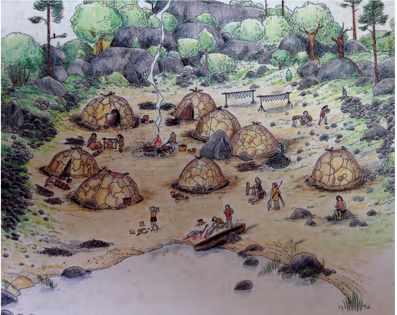
Så här kan det ha sett ut på stranden i Tråsättra. Illustration: Pia Larsson, ur "Vedmora - en gropkeramisk boplats".