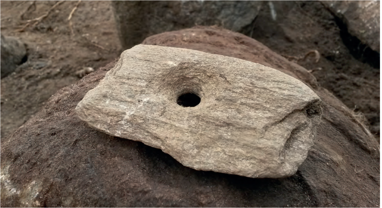
Sänke av glimmerskiffer.