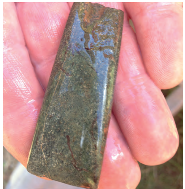
Mejsel av grönsten.

Metkrokar gjordes av ben. Ett nätsänke som vi hittade var gjort av glimmerskiffer. Andra fiskeredskap som nät och mjärdar var gjorda av växtfiber och tunna rötter och finns därför mycket sällan bevarade i det arkeologiska materialet.