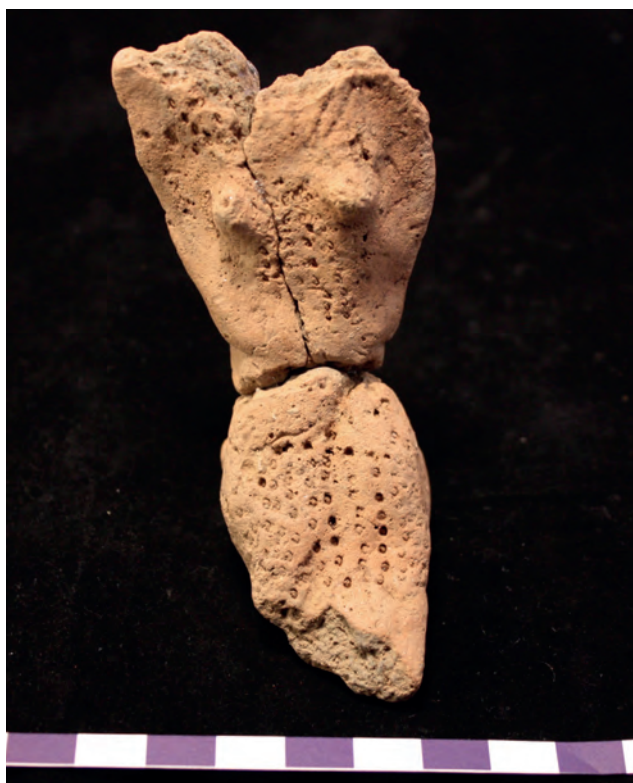
Kvinnofigur. Dekoren ger en idé om hennes klädedräkt.