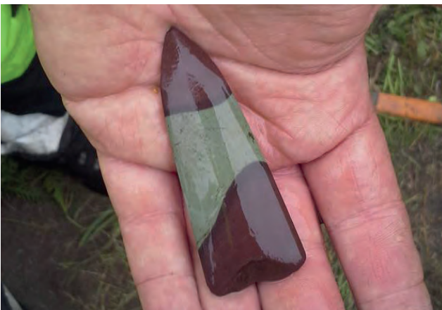
Pilspets av skiffer.

Skrapor användes för att skrapa bort fett på djurhudar och för att bearbeta trä. Med sylarna gjordes hål. Mejslar av grönsten användes för att snida i trä, ben och horn. Yxorna var ofta gjorda av grönsten. Skaftet av trä som stenyxorna suttit på är sedan länge förmultnade.