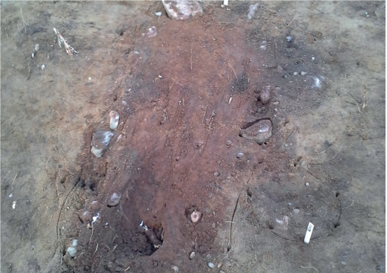
En av Tråsättras förmodade gravar. Graven var cirka en halv meter djup och färgad av rödockra.