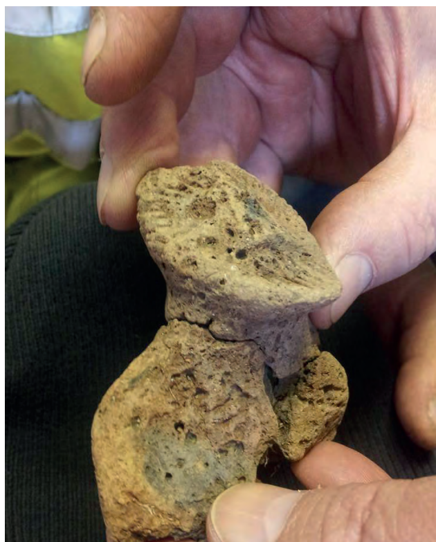
En skäggig man tittar upp mot skyn.