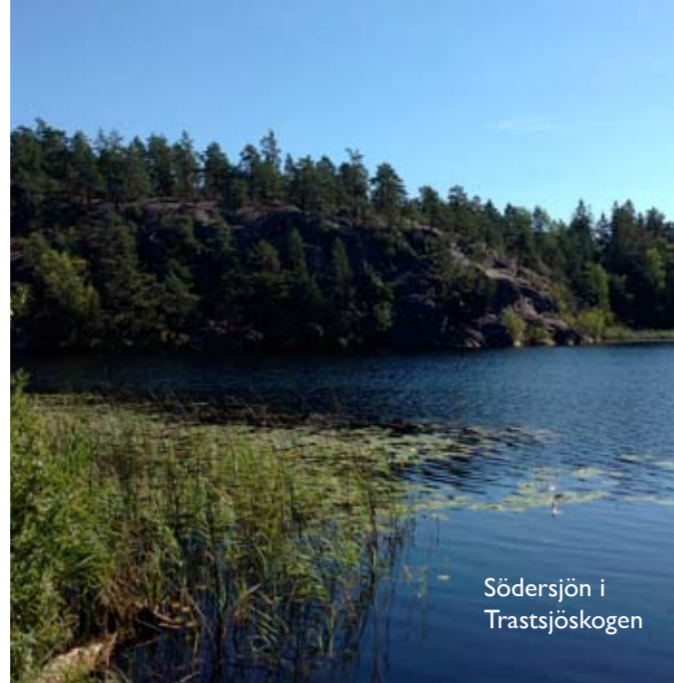
Södersjön i Trastsjöskogen