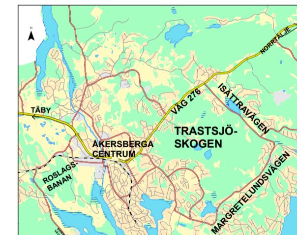
0 0,5 1 2 Kilometers

Kontaktinformation: Österåkers kommun, www.osteraker.se , tfn. 08-540 810 00