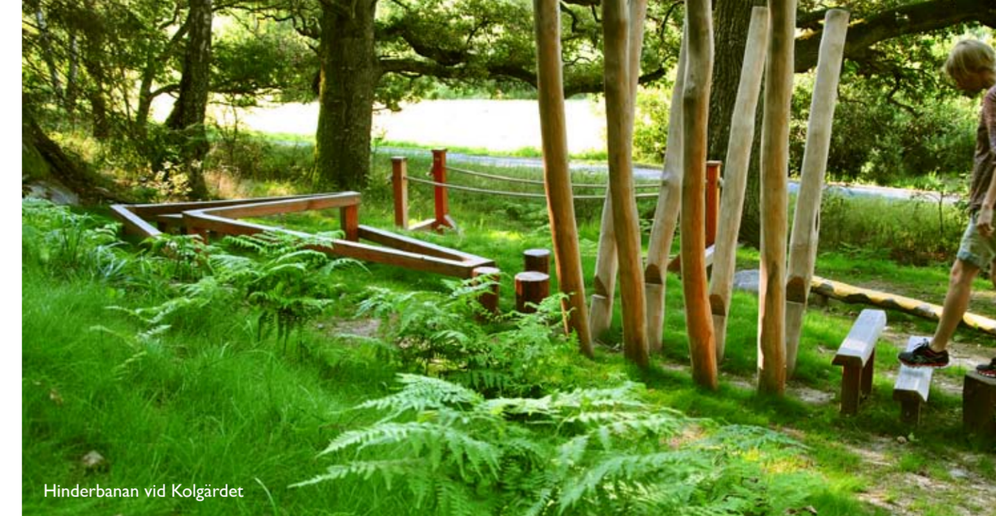
Hinderbanan vid Kolgårdet

Många av lämningarna från sten- och järnåldern ligger dolda under marken, men om du tittar noga kan du skimta dem. Kanske är stenhögen under mossan en gammal jordkällare? En rad med stenblock kan vara muren till en fossil åker: