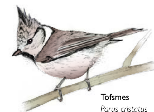
Tofsme Parus cristatus

Kontaktinformation: Österåkers kommun, www.osteraker.se , tfn. 08-540 810 00