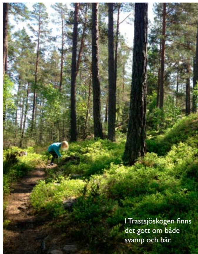
I Trastsjöskogen finns det gott om både svamp och bär.

I Trastsjöskogen finns det flera fina hällmarksområden beväxade med äldre tallskog, så kallad hällmarkstallskog. De magra förhållandena gör att tallarna växer långsamt. Det är inte så många andra träd som klarar de tuffa villkoren men tallen är stormfast och tål torka bra. Träden är ofta mycket gamla trots sin ringa storlek, ibland över 200 år. I Trastsjöskogens finns även så kallade "nyckelbiotoper" och "objekt med naturvärde", vilka är områden med särskilt höga naturvärden. Här finns förutsättningar för ovanliga växter, djur och svampar att leva som annars har svårt att överleva i skog som brukas hårt.